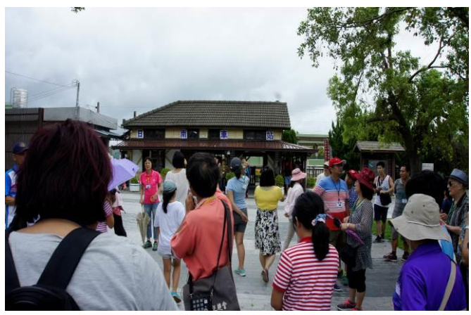
8/23 日南火車站(市定古蹟)