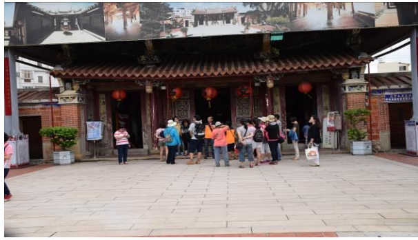
8/15 溪南文昌祠實地試測