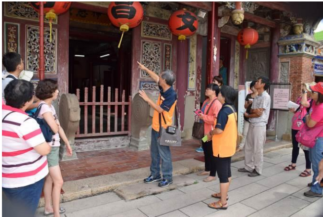
8/15 溪南文昌祠實地試測