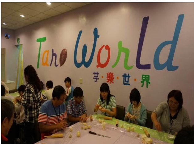
8/23 第一梯次阿聰師觀光工廠