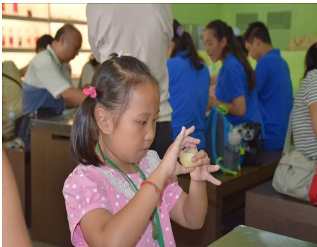
9/5 阿聰師芋頭酥 DIY