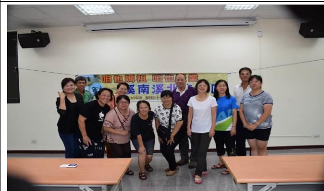
08/17 導覽行前會前會協商