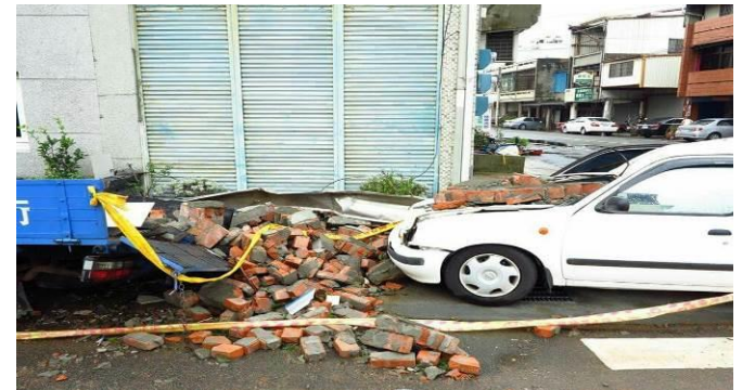
8/9 日南火車站實地試測