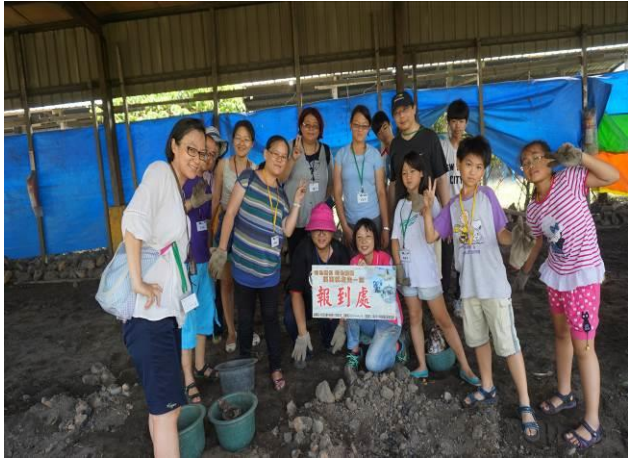
8/23 向日葵古窯風味餐