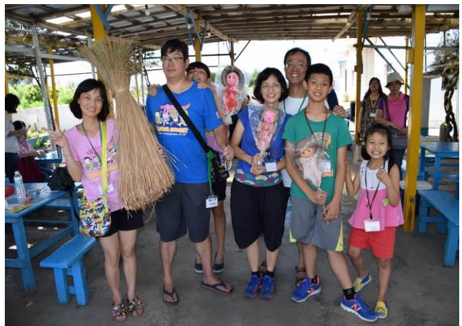
9/5 向日葵藺草娃娃 DIY