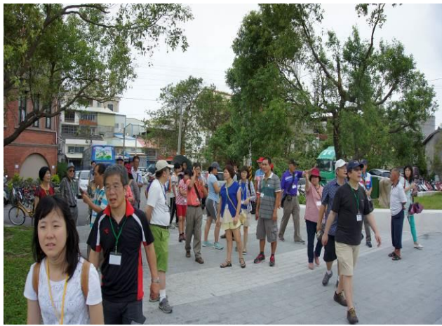
8/23 日南火車站(市定古蹟)