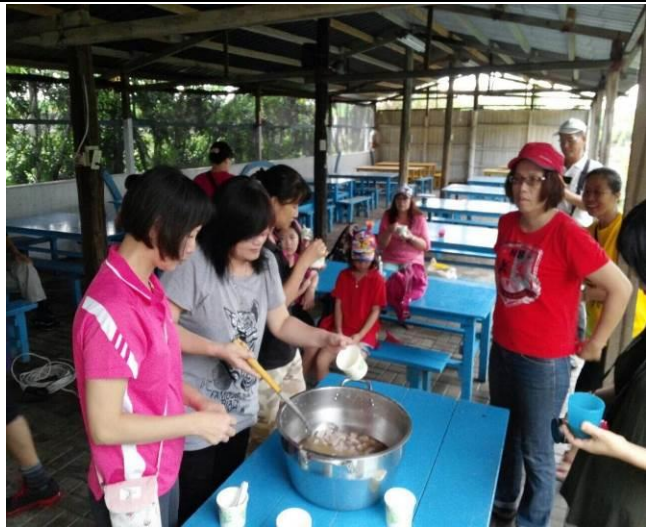
8/9 向日葵農場實地試測