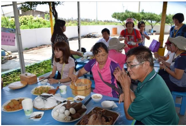
9/5 向日葵古窯風味餐