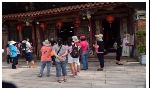
8/15 溪南文昌祠實地試測