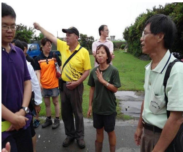
8/9 向日葵農場實地試測