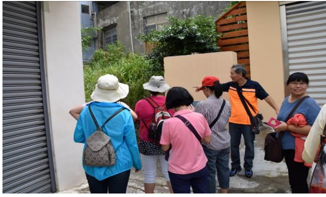
8/15 溪南巷弄路嬌姑媽實地試測