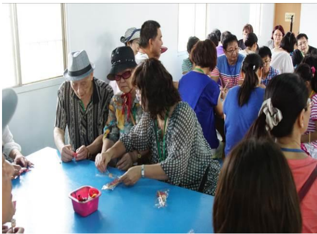
8/23 向日葵藺草娃娃 DIY