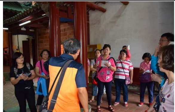
8/15 溪南文昌祠實地試測