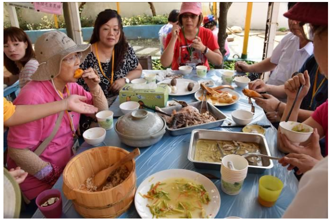
9/5 向日葵古窯風味餐