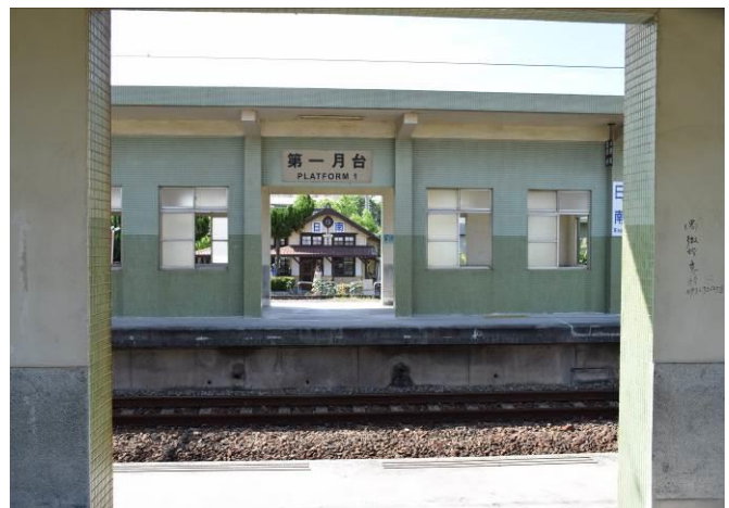
9/5 日南車站(市定古蹟)