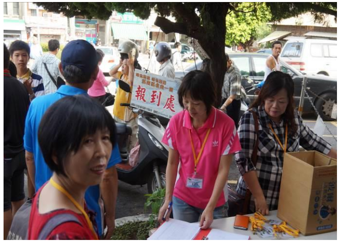
8/23 第一梯次大甲火車站集結