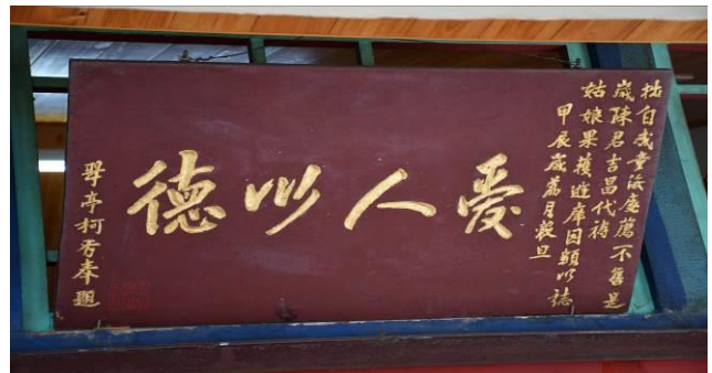
8/15 溪南巷弄路嬌姑媽實地試測