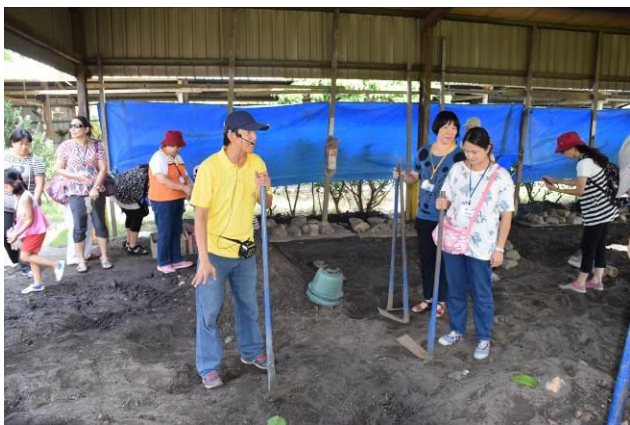
9/5 向日葵古窯風味餐