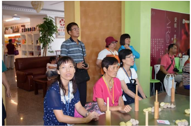
9/5 阿聰師芋頭酥 DIY