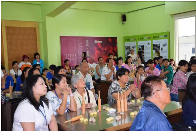
9/5 阿聰師芋頭酥 DIY