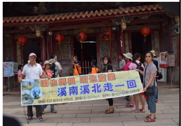
8/15 溪南文昌祠實地試測