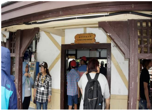
8/23 日南火車站(市定古蹟)