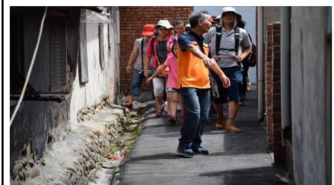
8/15 溪南巷弄鹽館實地試測