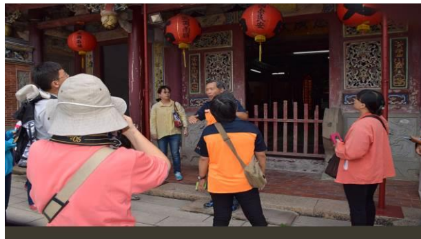
8/15 溪南文昌祠實地試測