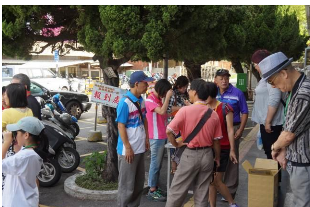
8/23 第一梯次大甲火車站集結