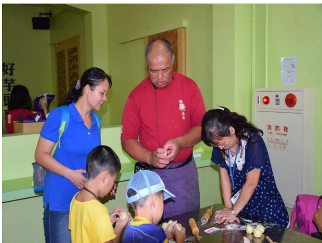
9/5 阿聰師芋頭酥 DIY