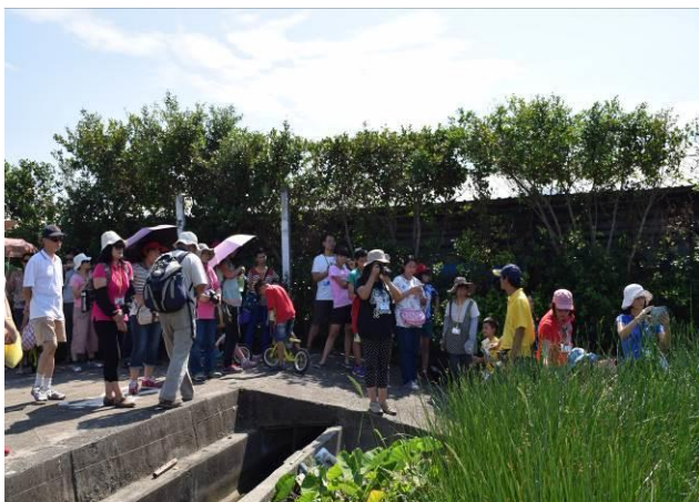
9/5 向日葵藺草娃娃 DIY