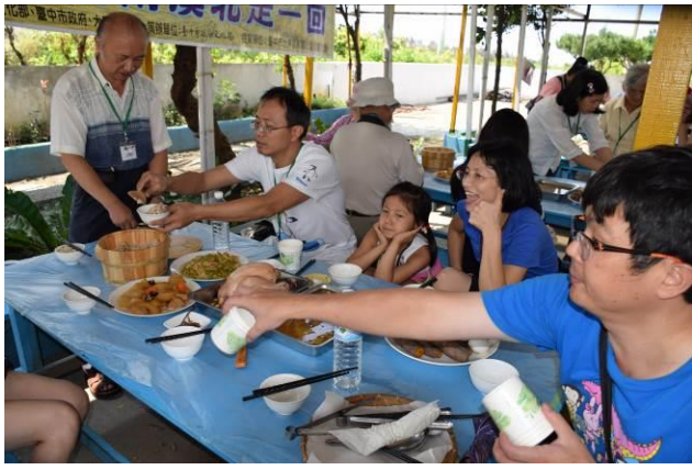
9/5 向日葵古窯風味餐