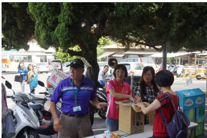
8/23 第一梯次大甲火車站集結