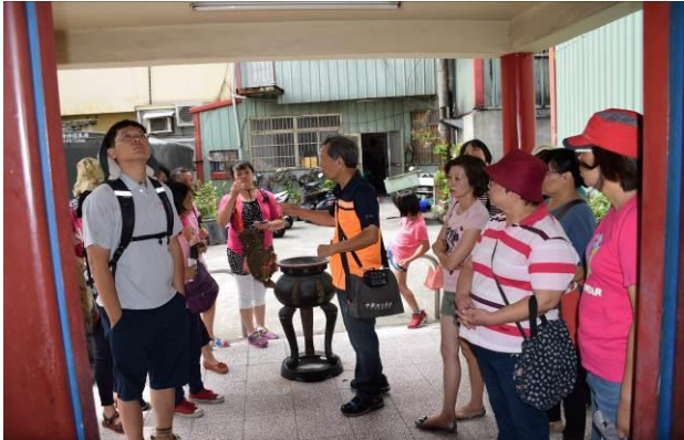
8/15 溪南巷弄路嬌姑媽實地試測