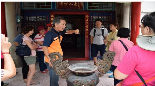
8/15 溪南巷弄路嬌姑媽實地試測