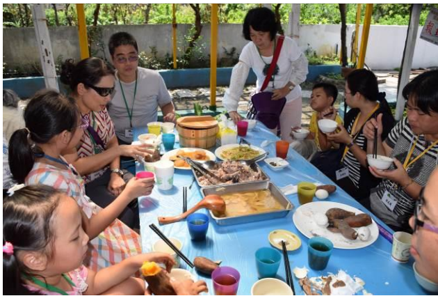
9/5 向日葵古窯風味餐