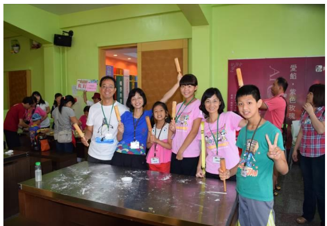
9/5 阿聰師芋頭酥 DIY