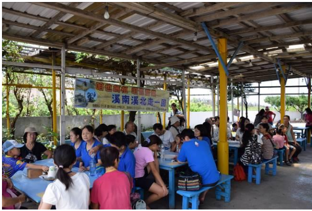
9/5 向日葵古窯風味餐