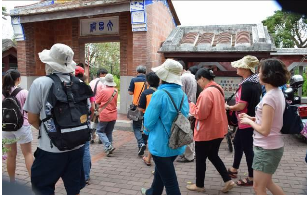
8/15 溪南文昌祠實地試測