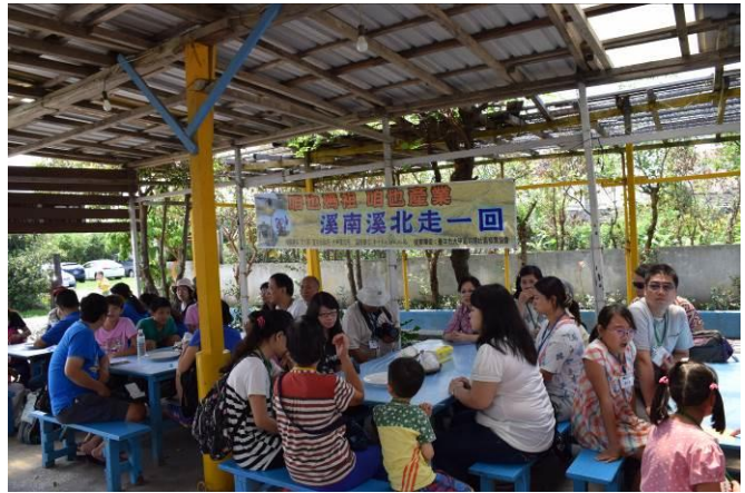
9/5 向日葵古窯風味餐