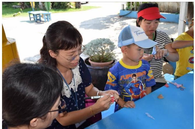
9/5 向日葵蘭草娃娃 DIY