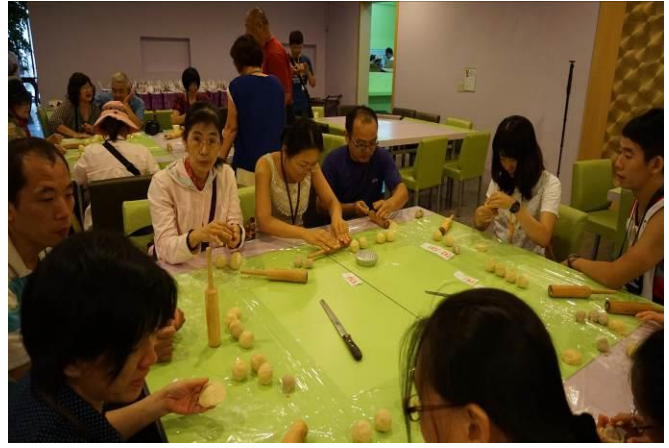
8/23 第一梯次阿聰師觀光工廠