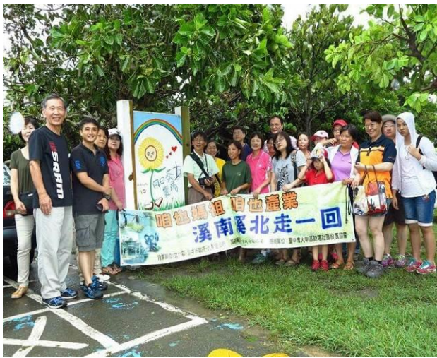
8/9 向日葵農場實地試測