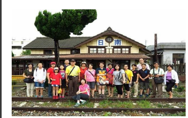
8/9 日南火車站實地試測