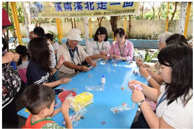
9/5 向日葵蘭草娃娃 DIY