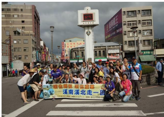
8/23 第一梯次大甲火車站集結