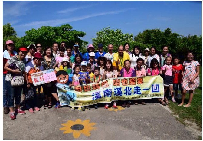
9/5 向日葵蘭草娃娃 DIY