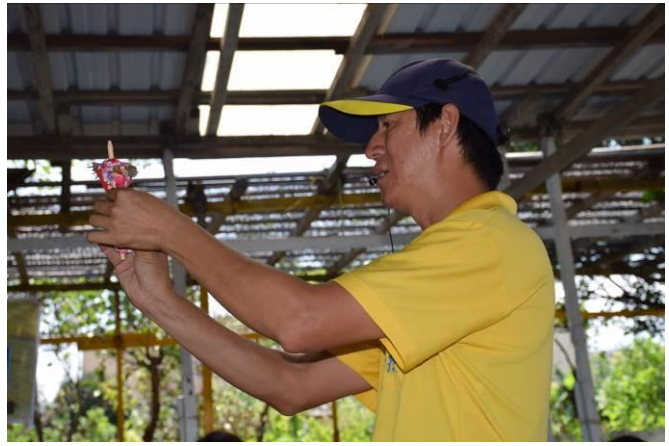
9/5 向日葵古窯風味餐