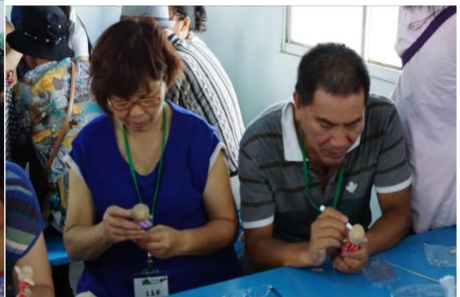
8/23 向日葵藺草娃娃 DIY