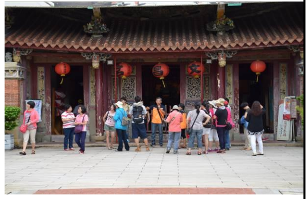
8/15 溪南文昌祠實地試測