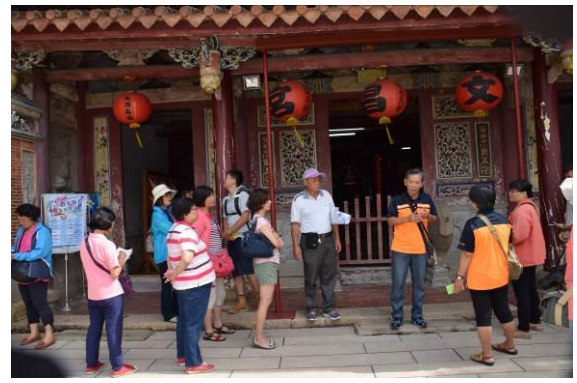
8/15 溪南文昌祠實地試測