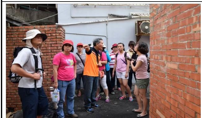
8/15 溪南巷弄鹽館實地試測