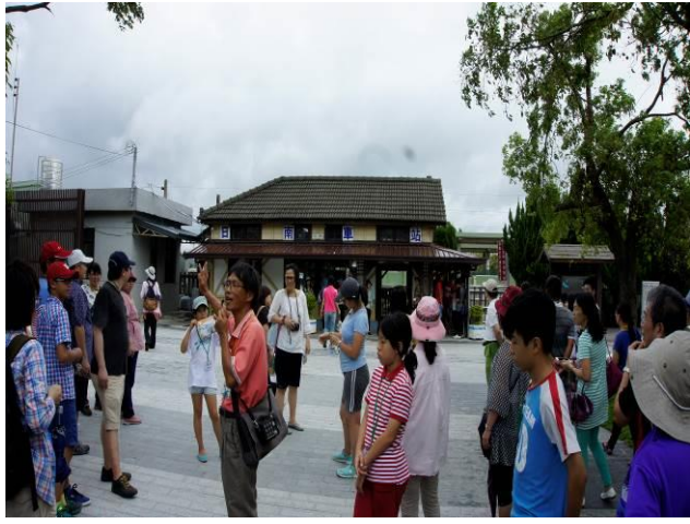
8/23 日南火車站(市定古蹟)