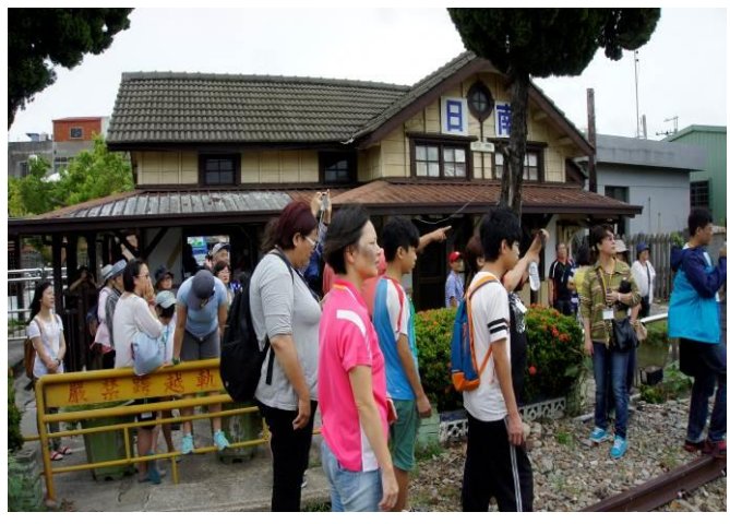
8/23 日南火車站(市定古蹟)