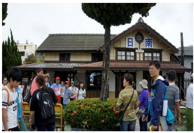
8/23 日南火車站(市定古蹟)