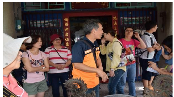
8/15 溪南巷弄路嬌姑媽實地試測