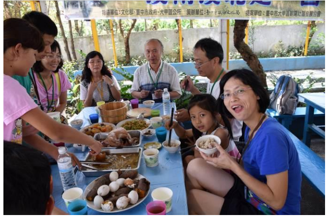
9/5 向日葵古窯風味餐