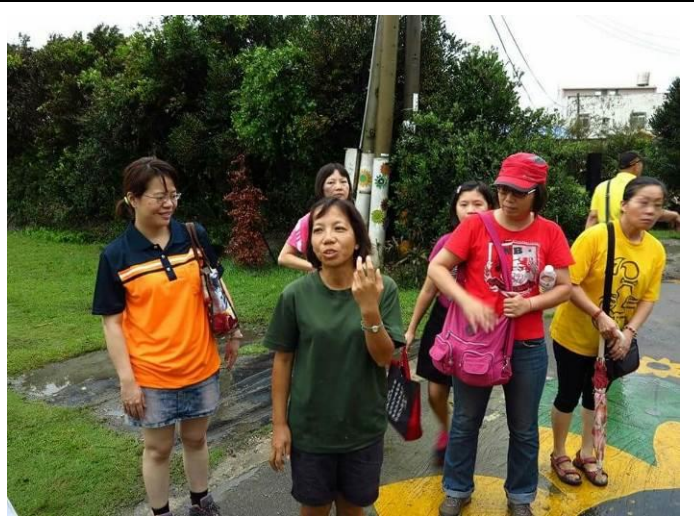
8/9 向日葵農場實地試測