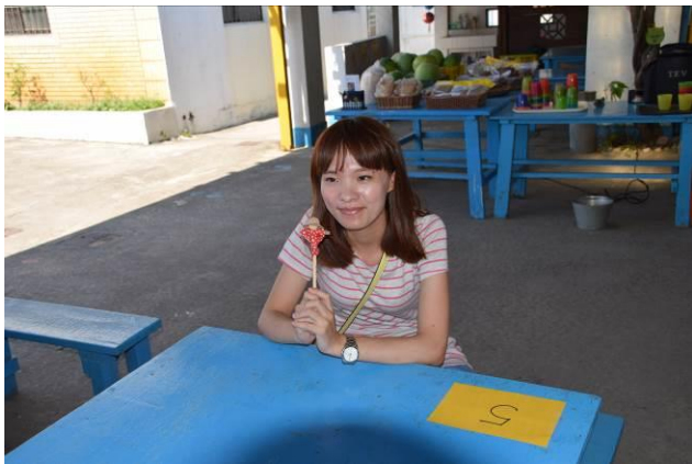
9/5 向日葵蘭草娃娃 DIY