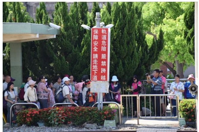
9/5 日南車站(市定古蹟)