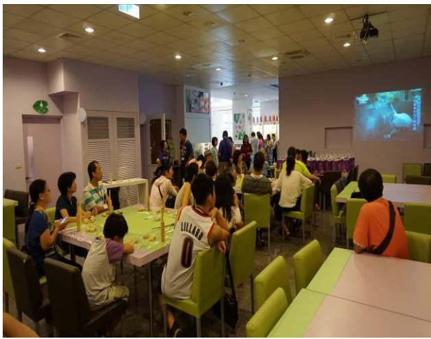
8/23 第一梯次阿聰師觀光工廠