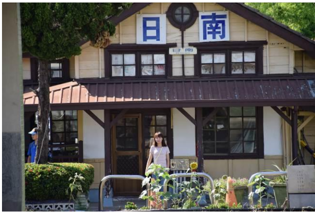
9/5 日南車站(市定古蹟)