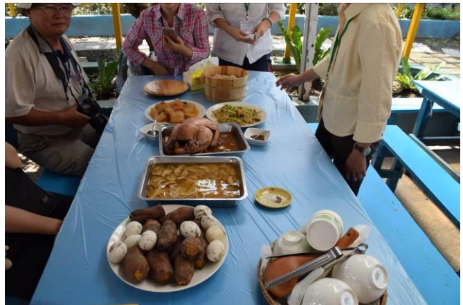
9/5 向日葵古窯風味餐