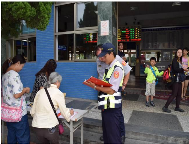
9/5 大甲火車站集結(波麗士大人關心)