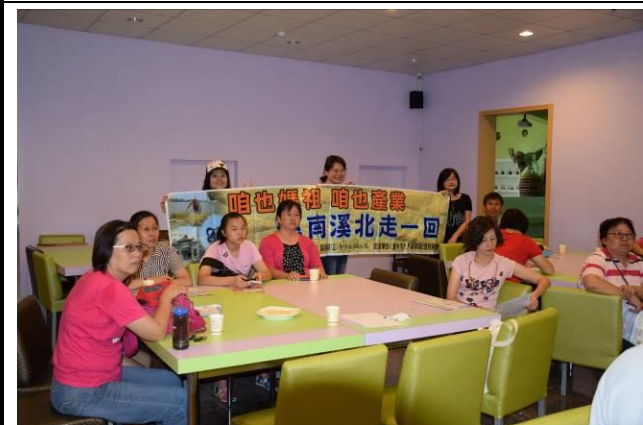
8/15 溪南阿聰師觀光工廠實地試測