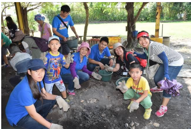
9/5 向日葵古窯風味餐