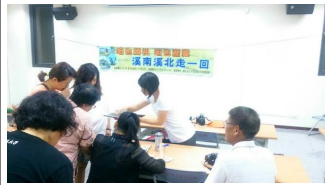
08/17 導覽行前會前會協商