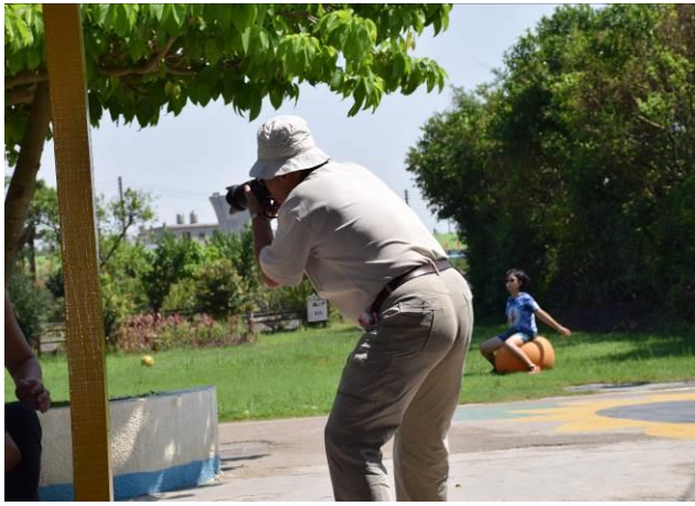
9/5 向日葵古窯風味餐