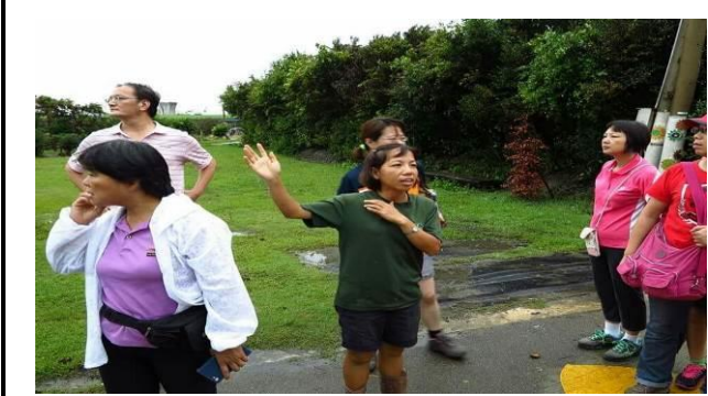
8/9 向日葵農場實地試測