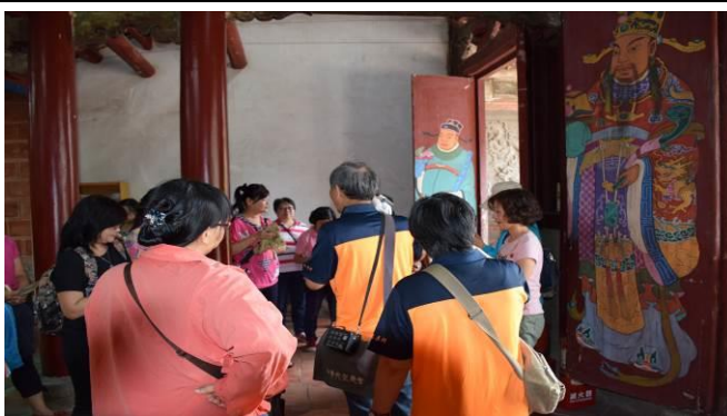
8/15 溪南文昌祠實地試測