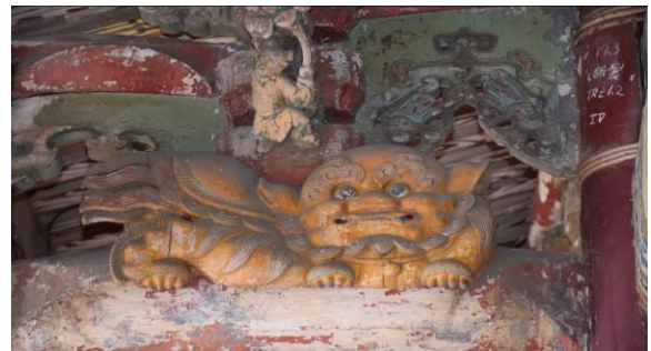
8/15 溪南文昌祠實地試測