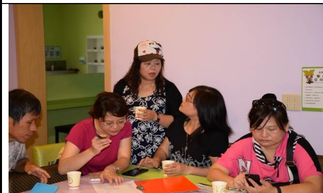
8/15 溪南阿聰師觀光工廠實地試測