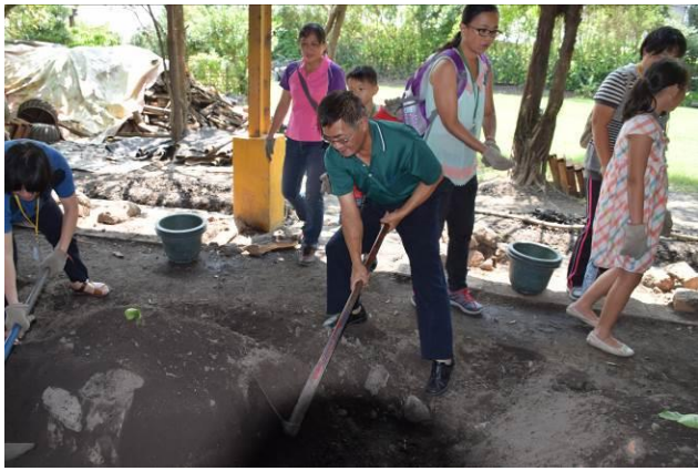
9/5 向日葵古窯風味餐