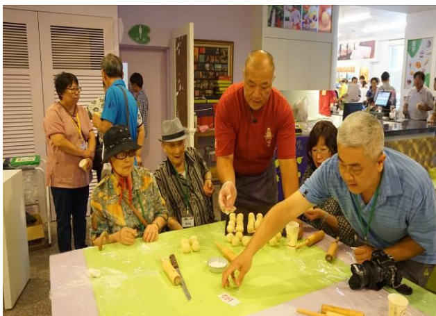
8/23 第一梯次阿聰師觀光工廠