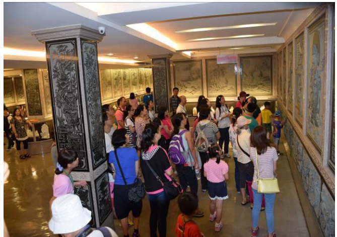
9/5 鎮瀾宮天妃顯聖錄講解