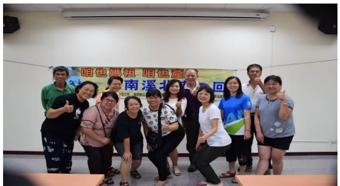
08/17 導覽行前會前會協商