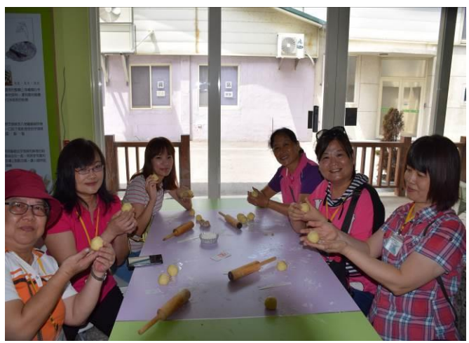
9/5 阿聰師芋頭酥 DIY