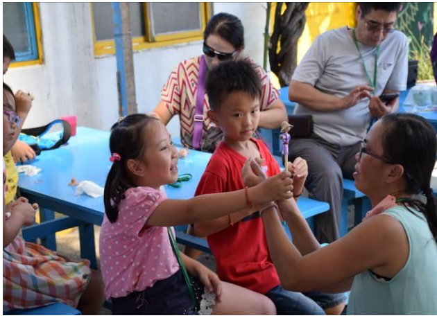
9/5 向日葵藺草娃娃 DIY