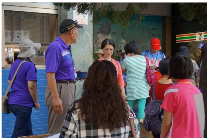
8/23 第一梯次大甲火車站集結