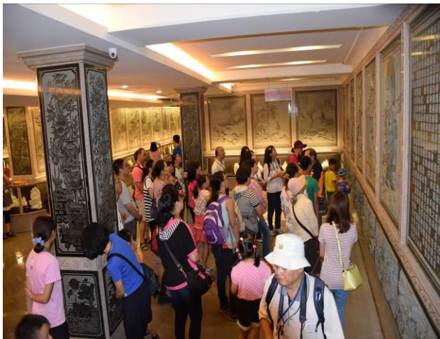
9/5 鎮瀾宮天妃顯聖錄講解