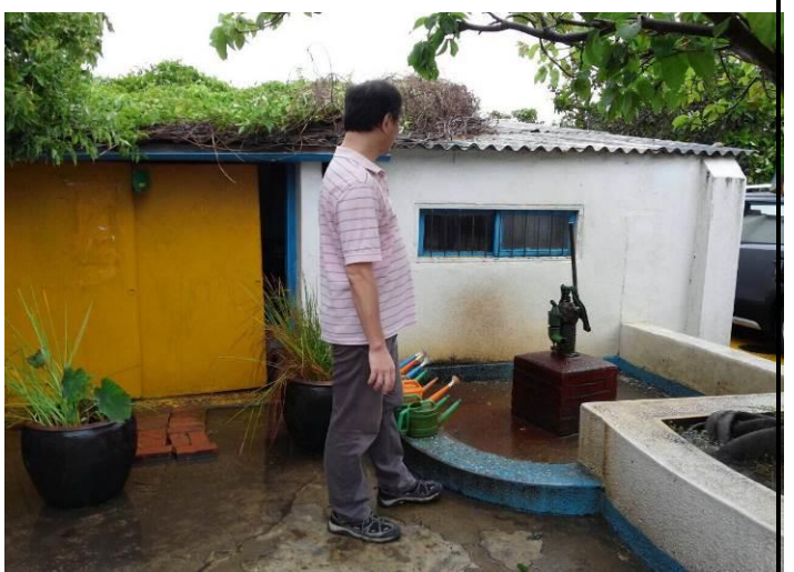
8/9 向日葵農場實地試測