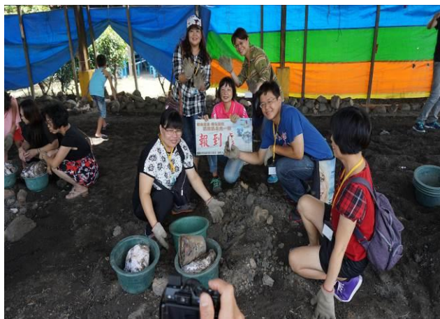
8/23 向日葵古窯風味餐