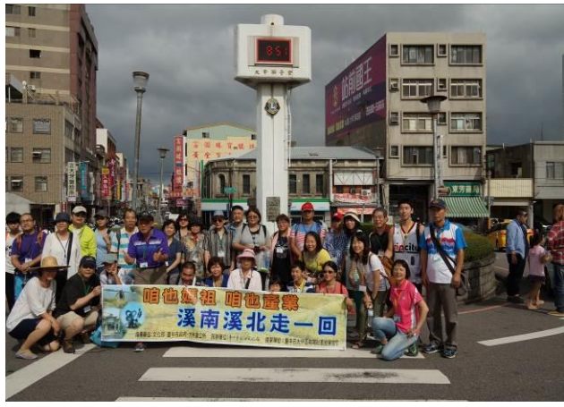
8/23 第一梯次大甲火車站集結