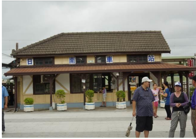
8/23 日南火車站(市定古蹟)