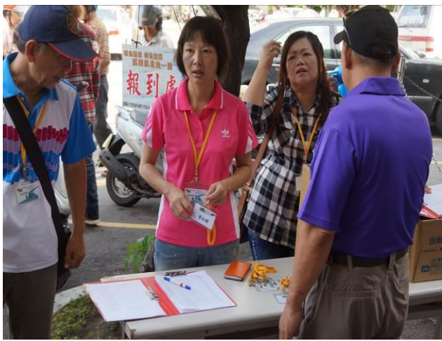
8/23 第一梯次大甲火車站集結