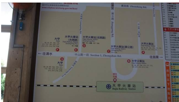
8/23 第一梯次大甲火車站集結