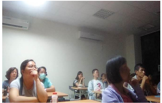
8/1 晚間導覽人員培訊