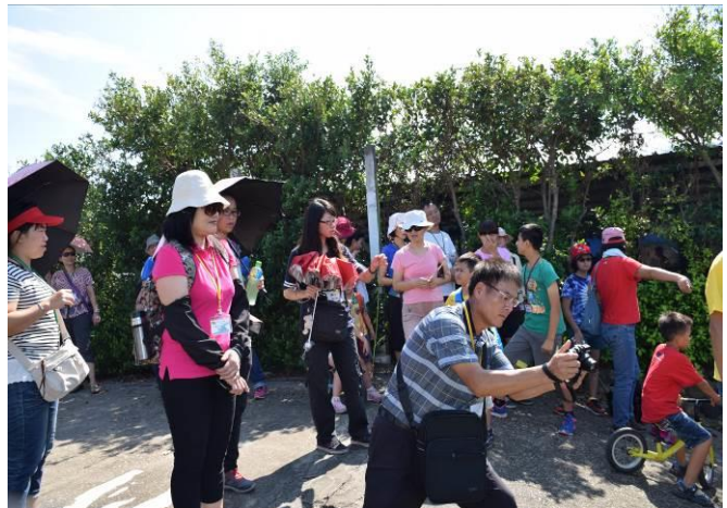
9/5 向日葵藺草娃娃 DIY