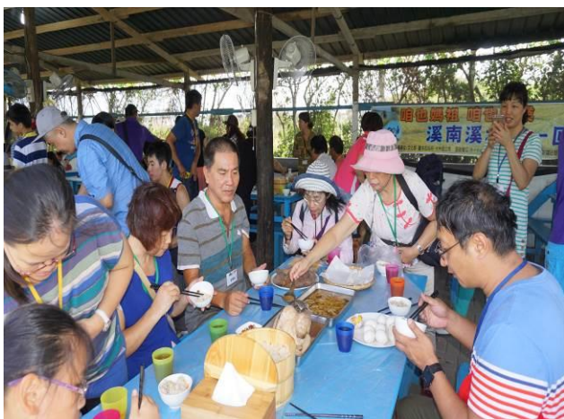
8/23 向日葵古窯風味餐