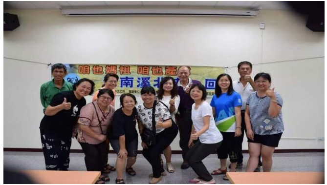
08/17 導覽行前會前會協商