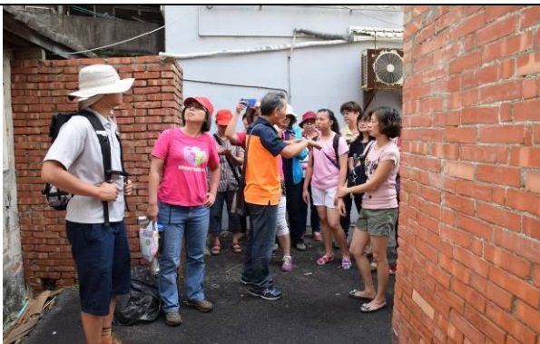
8/15 溪南巷弄鹽館實地試測