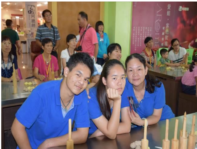
9/5 阿聰師芋頭酥 DIY