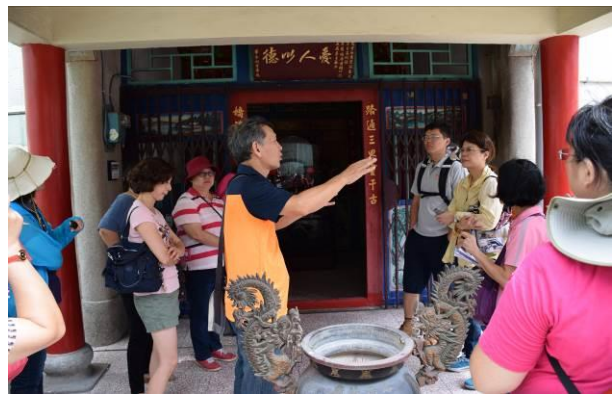
8/15 溪南巷弄路嬌姑媽實地試測