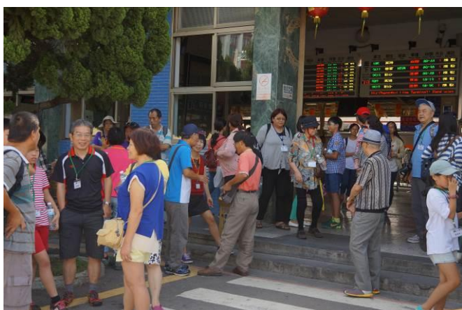
8/23 第一梯次大甲火車站集結