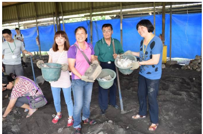
9/5 向日葵古窯風味餐