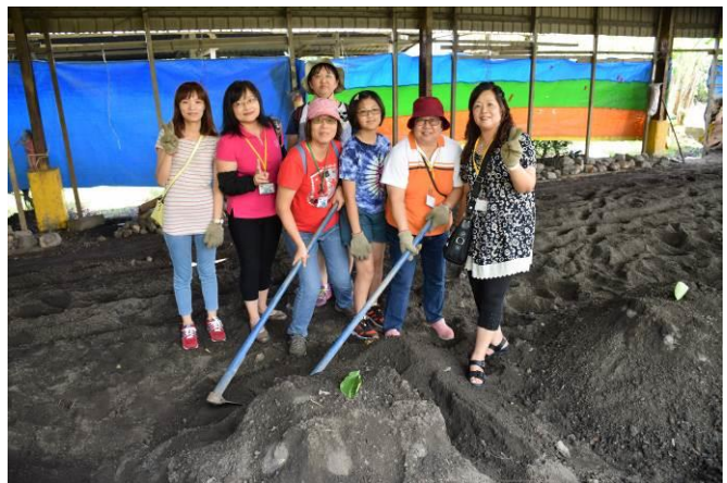
9/5 向日葵古窯風味餐