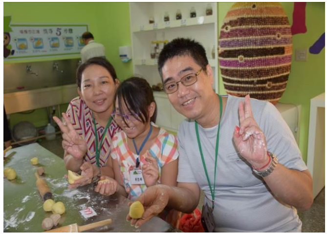
9/5 阿聰師芋頭酥 DIY