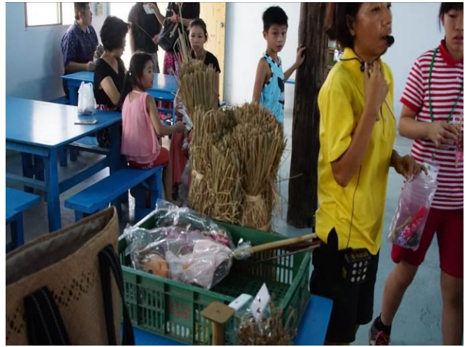
8/23 向日葵藺草娃娃 DIY