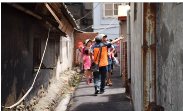
8/15 溪南巷弄鹽館實地試測