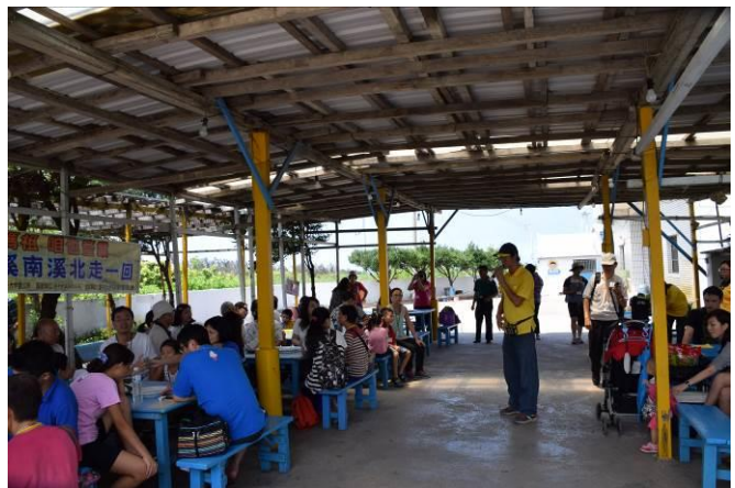
9/5 向日葵古窯風味餐