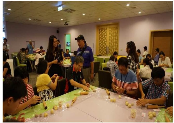
8/23 第一梯次阿聰師觀光工廠