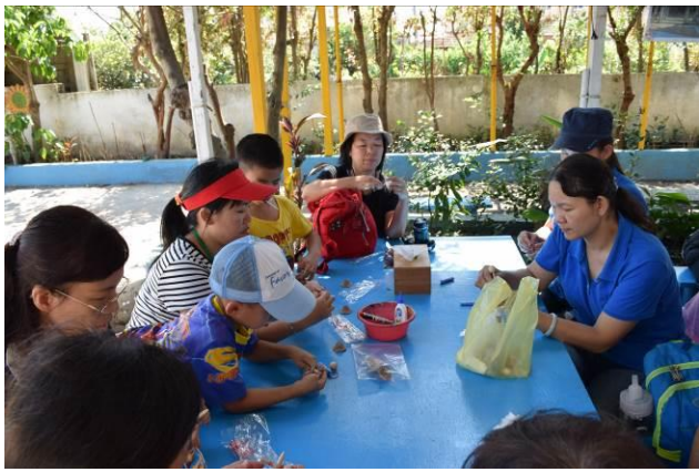
9/5 向日葵蘭草娃娃 DIY