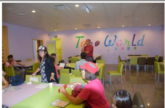
8/15 溪南阿聰師觀光工廠實地試測