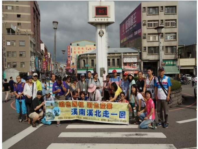
8/23 第一梯次大甲火車站集結