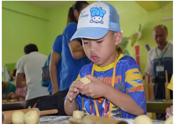
9/5 阿聰師芋頭酥 DIY