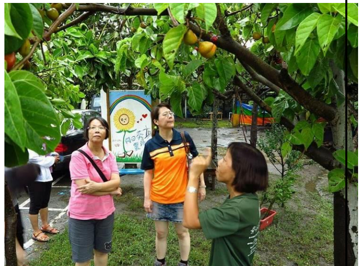
8/9 實際試測五里辦公室集結