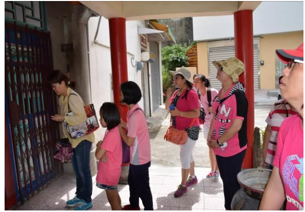
8/15 溪南巷弄路嬌姑媽實地試測