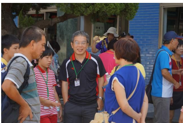
8/23 第一梯次大甲火車站集結