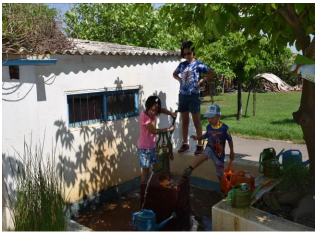
9/5 向日葵藺草娃娃 DIY