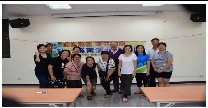
08/17 導覽行前會前會協商