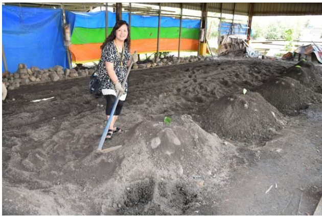
9/5 向日葵古窯風味餐