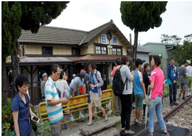
8/23 日南火車站(市定古蹟)