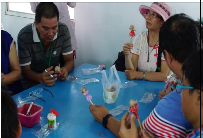
8/23 向日葵藺草娃娃 DIY