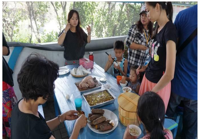
8/23 向日葵古窯風味餐