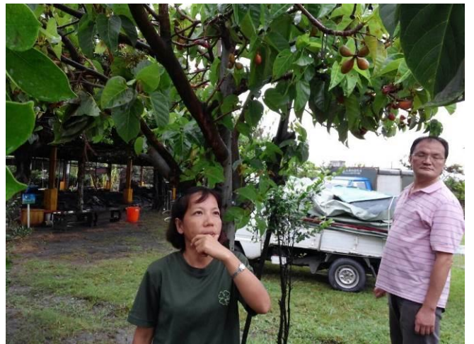
8/9 向日葵農場實地試測