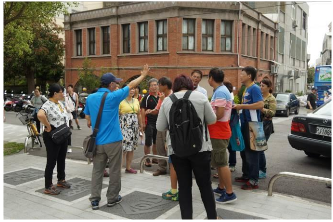
8/23 日南火車站(市定古蹟)