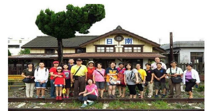
8/9 日南火車站實地試測