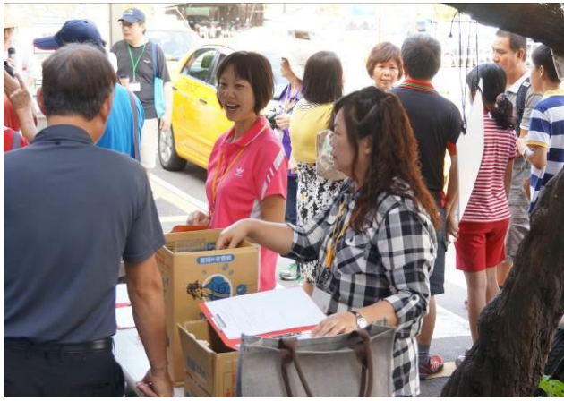
8/23 第一梯次大甲火車站集結