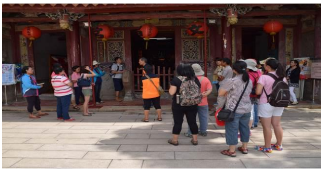
8/15 溪南文昌祠實地試測