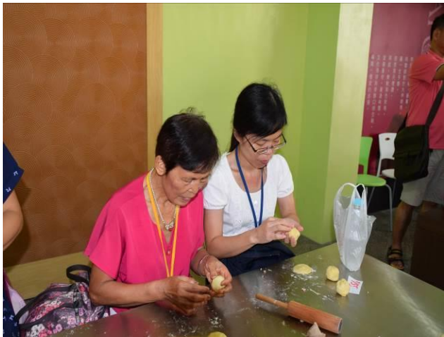
9/5 阿聰師芋頭酥 DIY