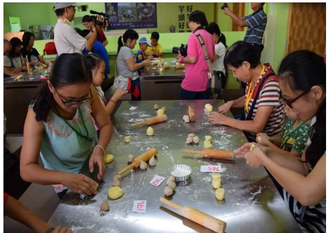
9/5 阿聰師芋頭酥 DIY