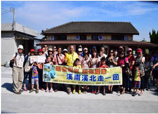
9/5 日南車站(市定古蹟)