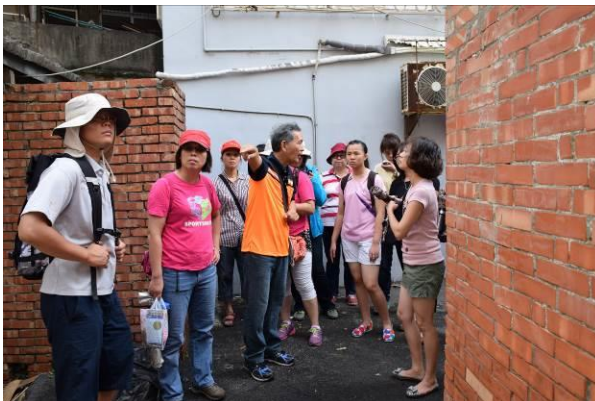
8/15 溪南巷弄鹽館實地試測