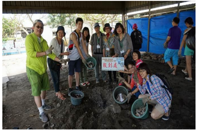
8/23 向日葵古窯風味餐