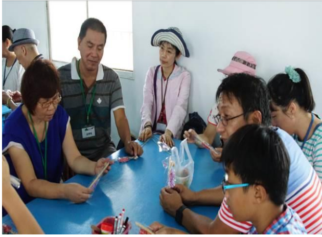
8/23 向日葵藺草娃娃 DIY