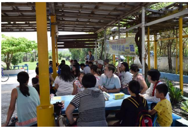
9/5 向日葵古窯風味餐