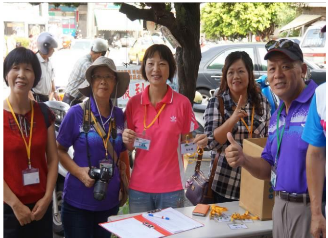
8/23 第一梯次大甲火車站集結