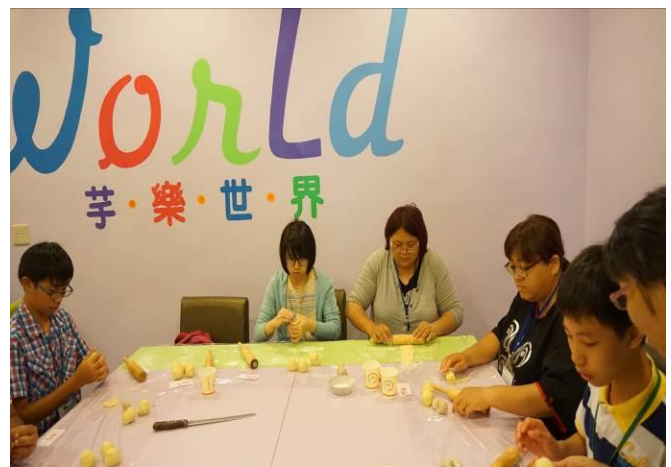
8/23 第一梯次阿聰師觀光工廠