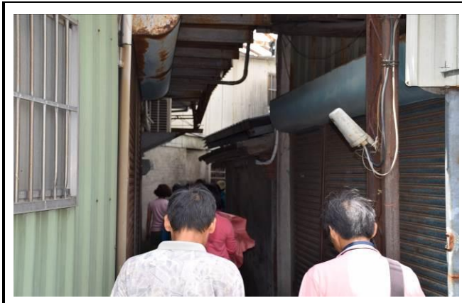
8/15 溪南巷弄鹽館實地試測