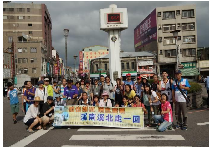
8/23 第一梯次大甲火車站集結