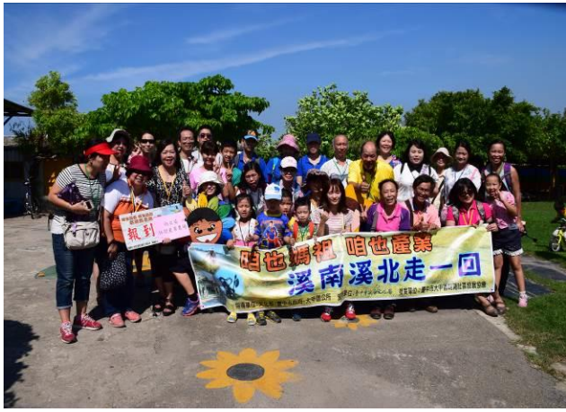
9/5 向日葵蘭草娃娃 DIY