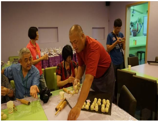
8/23 第一梯次阿聰師觀光工廠