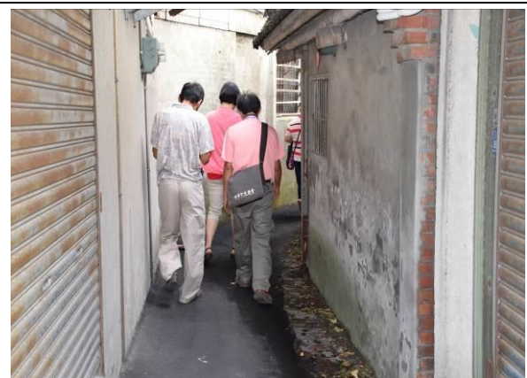
8/15 溪南巷弄鹽館實地試測