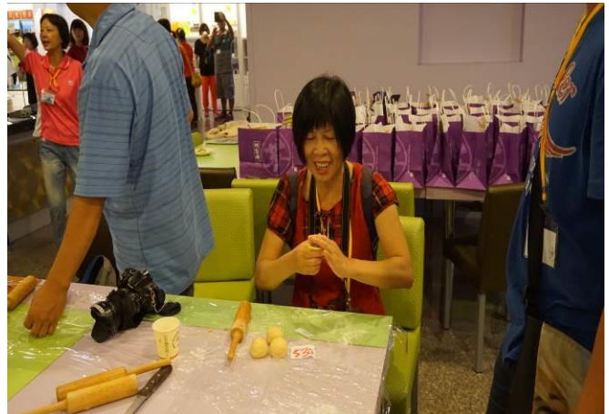
8/23 第一梯次阿聰師觀光工廠