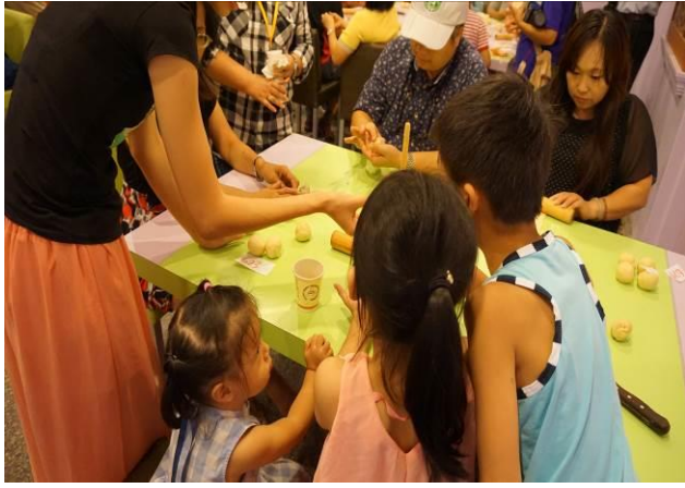
8/23 第一梯次阿聰師觀光工廠