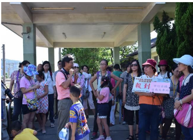
9/5 日南車站(市定古蹟)