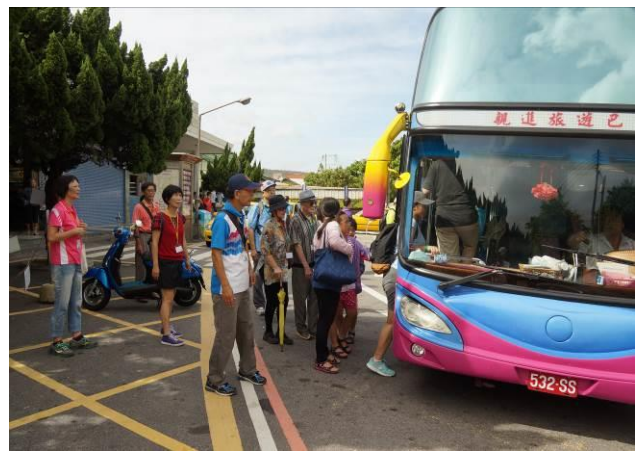
8/23 第一梯次大甲火車站集結