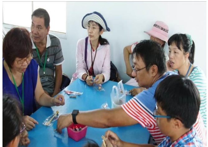
8/23 向日葵藺草娃娃 DIY