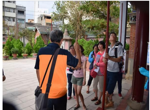
8/15 溪南文昌祠實地試測