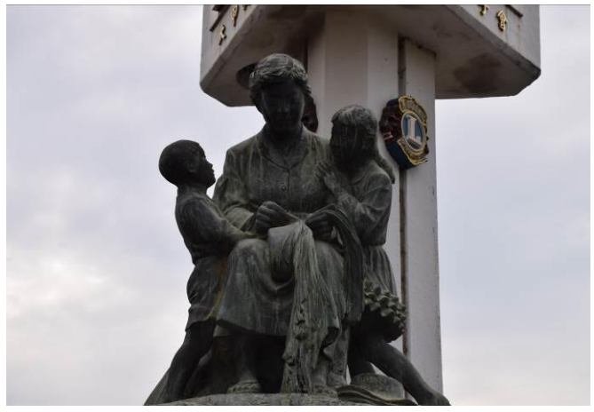
9/5 慈母像(火車站前)最後站在這裡的身影