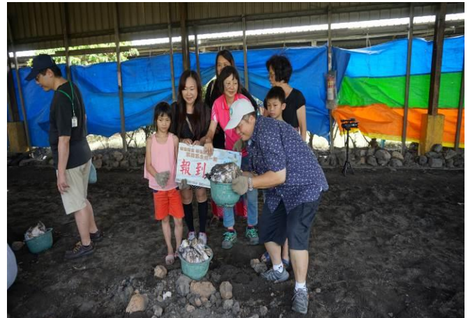
8/23 向日葵古窯風味餐