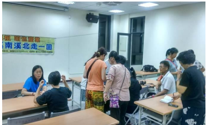
08/17 導覽行前會前會協商