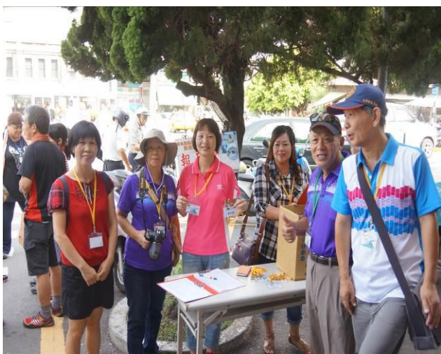
8/23 第一梯次大甲火車站集結