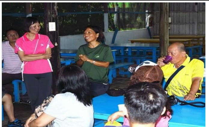
8/9 向日葵農場實地試測