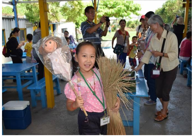
9/5 向日葵藺草娃娃 DIY