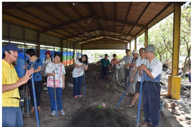
9/5 向日葵古窯風味餐