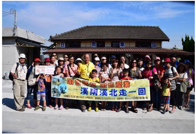
9/5 日南車站(市定古蹟)