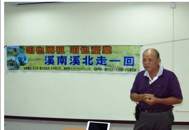
08/17 導覽行前會前會協商