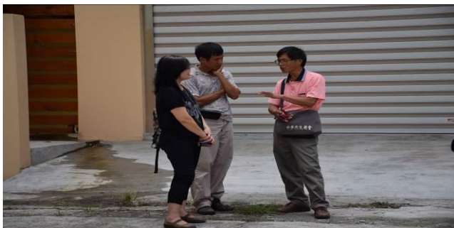
8/15 溪南巷弄路嬌姑媽實地試測