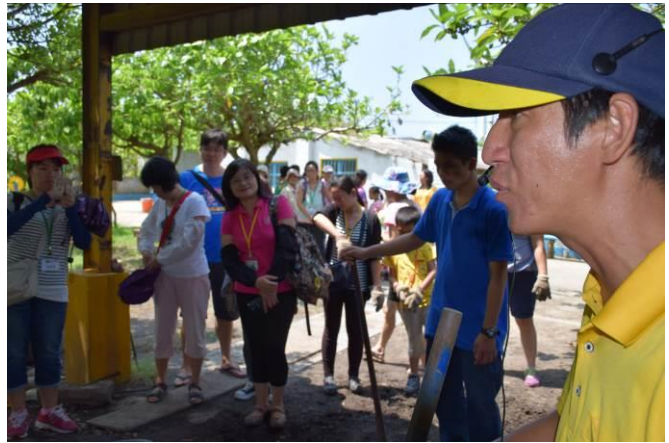
9/5 向日葵古窯風味餐