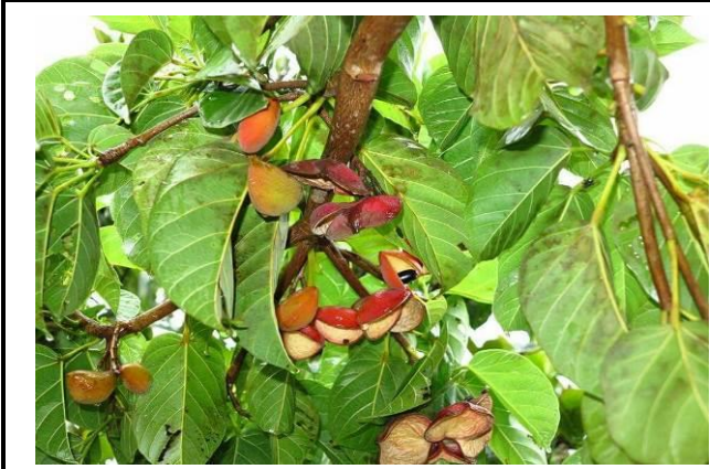
8/9 向日葵農場實地試測