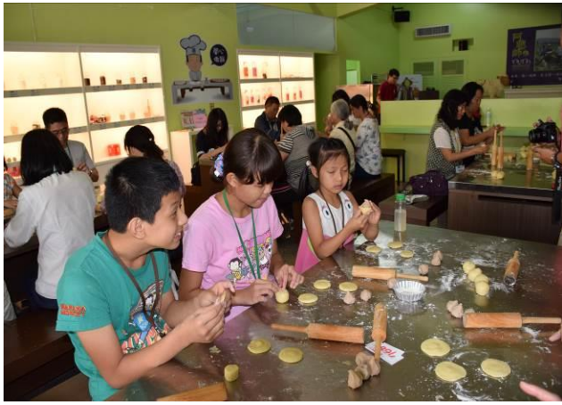
9/5 阿聰師芋頭酥 DIY