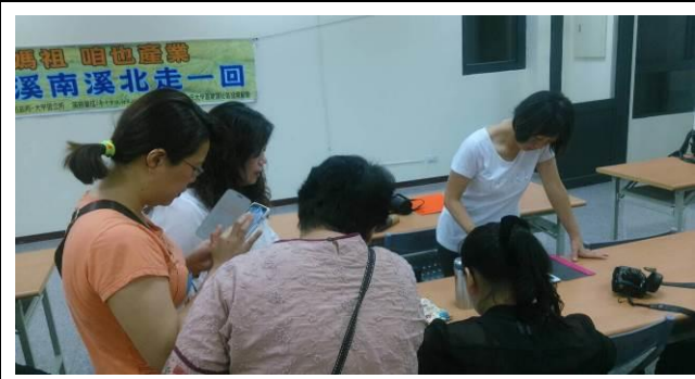
08/17 導覽行前會前會協商