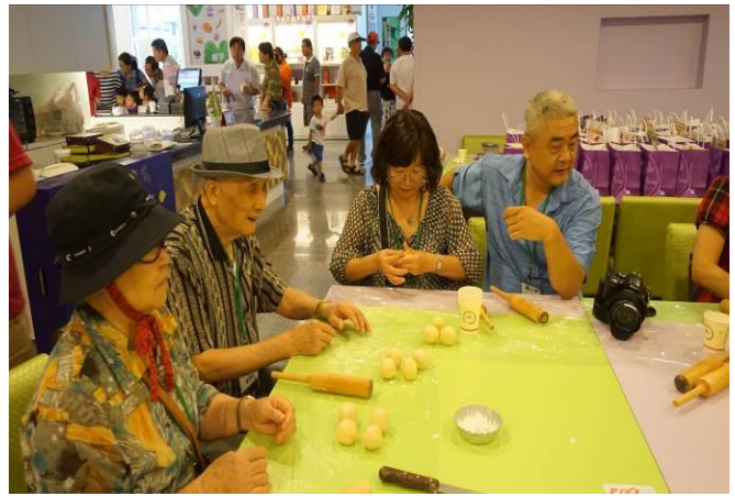
8/23 第一梯次阿聰師觀光工廠