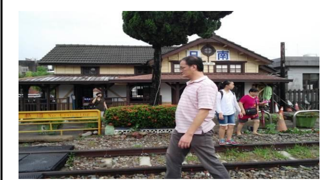
8/9 日南火車站實地試測