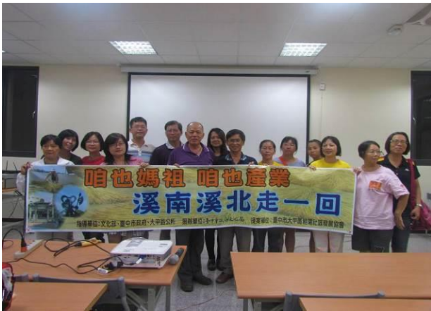
8/1 晚間導覽人員培訊