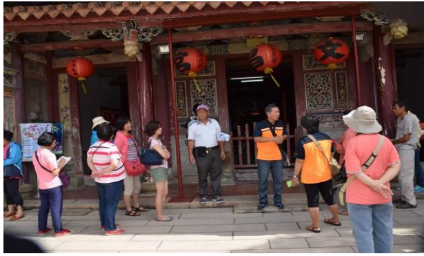
8/15 溪南文昌祠實地試測