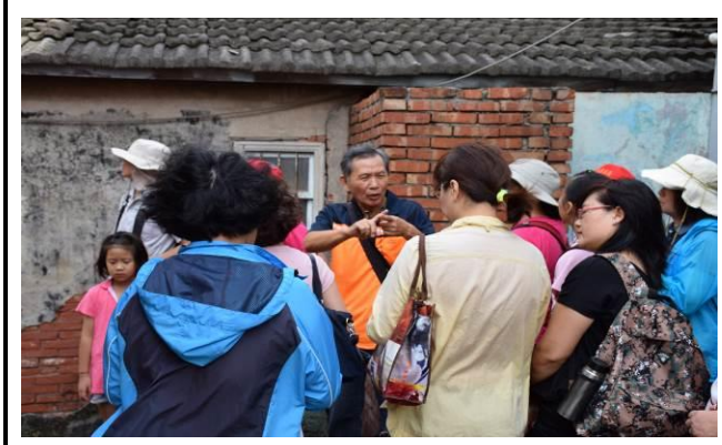
8/15 溪南巷弄鹽館實地試測