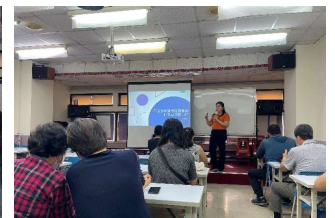
講師說明核銷應付的資料及內容