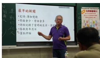
講師說明採訪的基本技巧