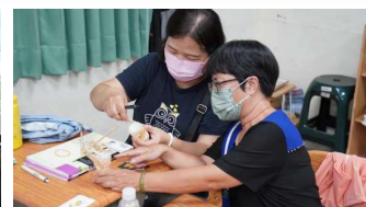
大屯社大- 學員運用廢棄物品手作