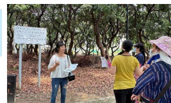
講師介紹整個園區概況及當初認養過程-參與社會運動的過程