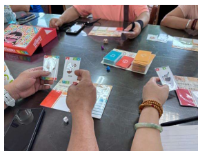
透過桌遊讓學員了解食農與SDGs連結