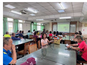
介紹性別教育、性別平等並配合教具、繪本及案例介紹