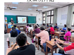
講師說明什麼是社區協力農業