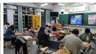
探討大里溪流域的重大災變