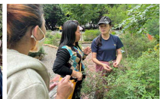
園區內的五感體驗