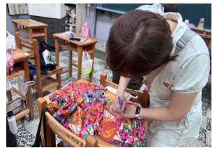
二手衣回收創作 講師指導學員手作技巧- 結合SDGs 12.5 指標(減少廢棄物的產生)