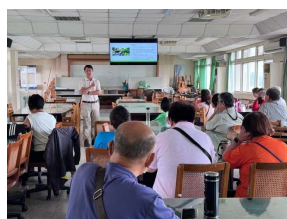
解說生態復育的概念